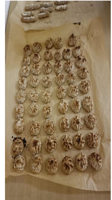
Einige Privatfotos von unserer Weihnachtsbäckerei