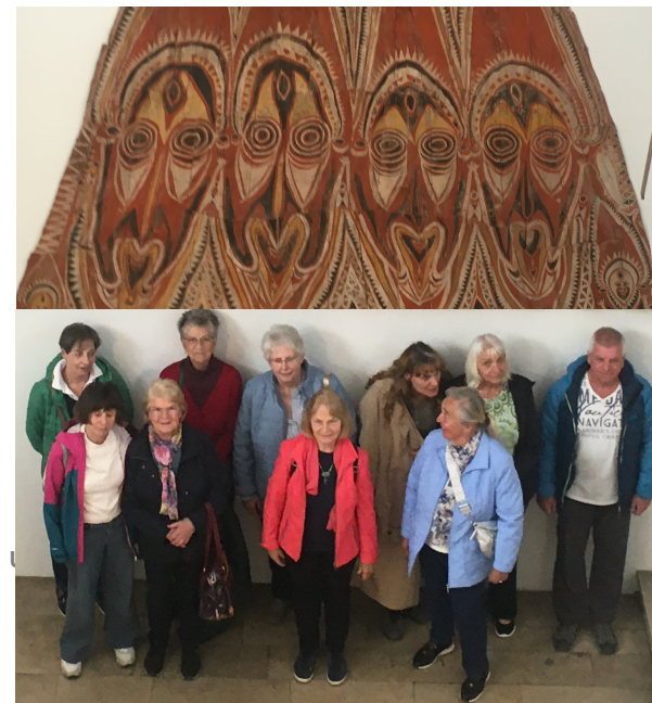
Besuch im Museum der Fünf Kontinente, München; Foto: E. Verdura