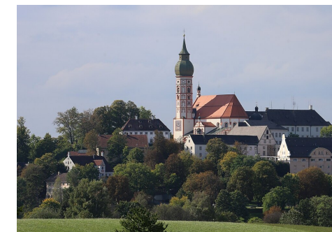
Kloster Andechs

Fahrt zum Ammersee: Dampferfahrt, Wanderung zum Kloster Andechs Nur mit Anmeldung: 0821/ 99879524 oder e.verdura@augzburg-asb.de