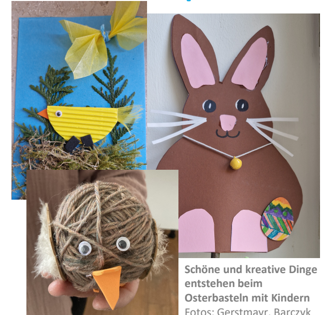
Schöne und kreative Dinge entstehen beim Osterbasteln mit Kindern