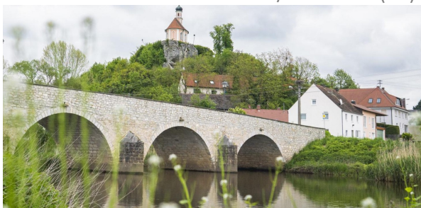
Wörnitzstein; Bild: ASB

Fahrt mit der Bahn nach Donauwörth; Wanderung nach Wörnitzstein; mit der Bahn nach Harburg; Stadtführung; nur mit Anmeldung bei e.verdura@augzburg-asb.de oder 0821/ 99879524 (AB)