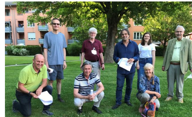
Unsere freiwillig Engagierten