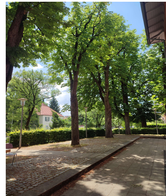
Privatfoto von unserer Terrasse